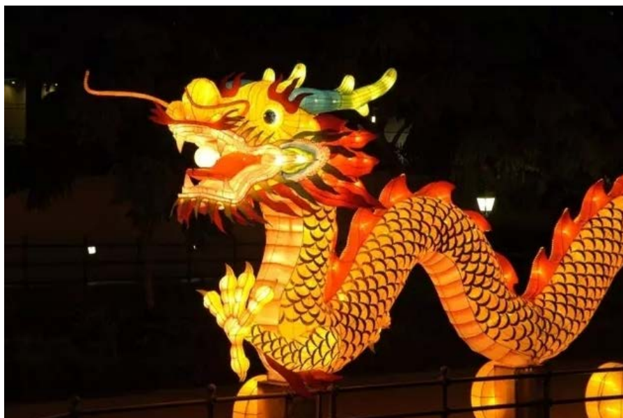
▲加拿大校园迎接龙年活动

那么“龙宝宝”们的出色表现，是不是因为他们在遗传上有什么先天优势，或者父母的收入水平、文化程度更高所致呢？