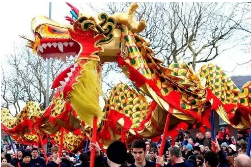
▲利物浦当地群众体验舞龙

美国《新闻周刊》也曾在2012年元月报道，由于预期龙年将迎来生育高峰，北京市的月嫂价格上涨了一倍，一些医院的妇产科病床也被预定到了2012年8月份。