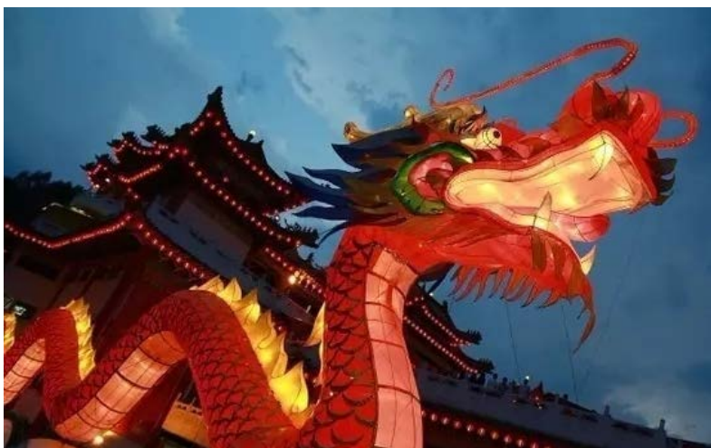
▲香港迎接龙年活动

每经小编（微信号：nbdnews）注意到，在香港、北京甚至海外华人聚集的地区，都曾出现过“龙宝宝”扎堆出生的现象。一些年轻夫妇会刻意计划备孕时间，争当“龙妈”（不是《权力的游戏》中那位）。