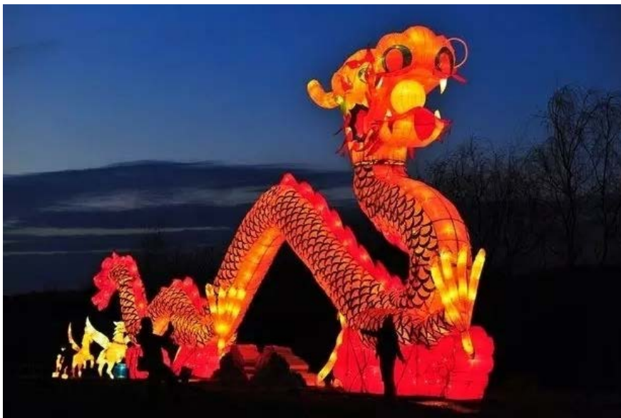
▲英国城市开展的中国农历新年展览

以英国为例，英国旅游局在2017年投入8500万英镑预算，在全英12个大城市同时铺开迎接鸡年新春活动。很多英国人在活动中被普及了中国生肖（Zodiac Sign）的常识。